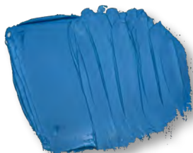
Bleu primaire dégradé à 50% avec du blanc de titane